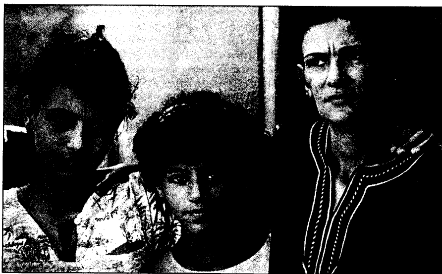
Palestinsk mor med to døtre. Jentenes far ble drept under angrepet på flyktingeleirene Sabra og Chatila for ti år siden.