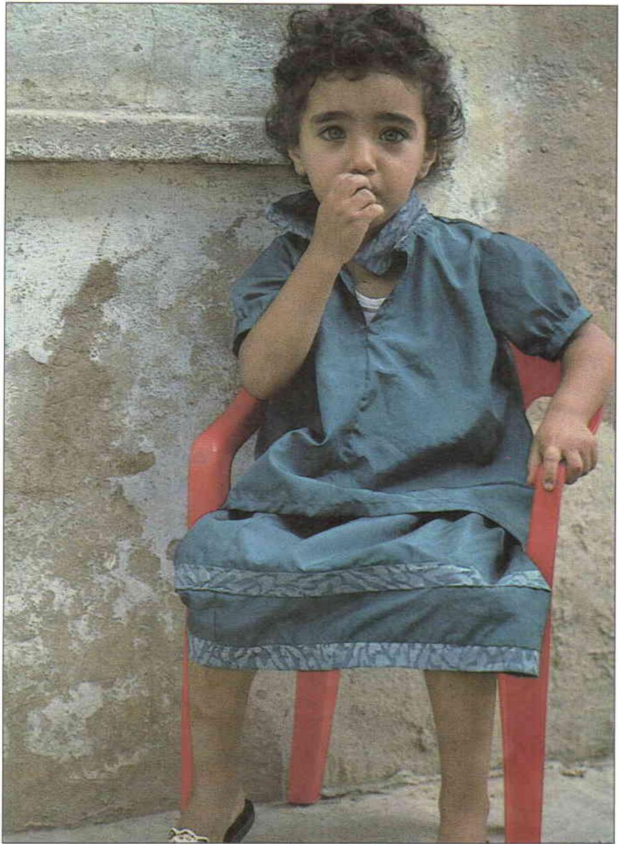
Mange palestinske barn sliter med utrygghet og bekymringer som kan få alvorlige konsekvenser for deres mentale utvikling.

Militære lukningsvedtekter og portforbud har medført at en stor del av skoleåret er gått tapt hvert av de siste årene under intifadaen. Flere ganger har portforbudet vart i ukevis, med noen timers opphold for å kunne proviantere. Skolene er også blitt et farlig område, hvor elever og lærere er blitt drept, skadd eller arrestert. Lærere som er blitt mistenkt for å være overløpere er blitt